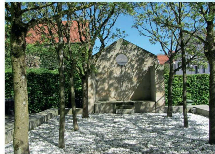
Mahn- und Gedenkstätte Synagoge Lemgo

Die Reihe befasst sich mit theologischen und historischen Fragestellungen, stellt Einzelpersonen oder Familien vor oder erinnert an Geschehnisse der jüngsten Geschichte in der Region.